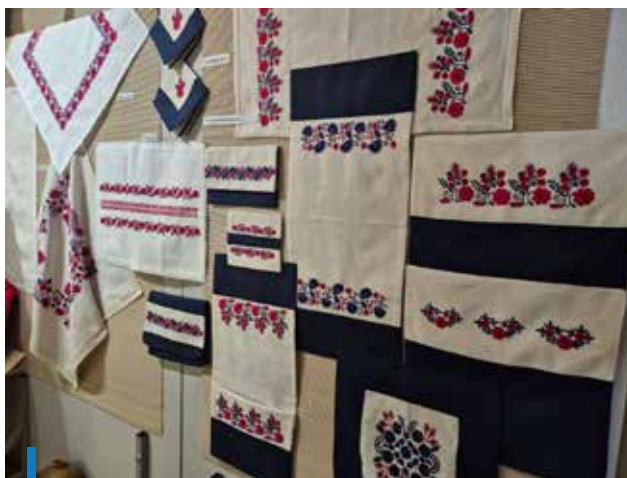
Modern korban is megvan a palóc minták helye és szerepe

A Magyar Művészeti Akadémia támogatásával létrejött kiállítás augusztus 22-ig látogatható naponta 10 és 17 óra között.