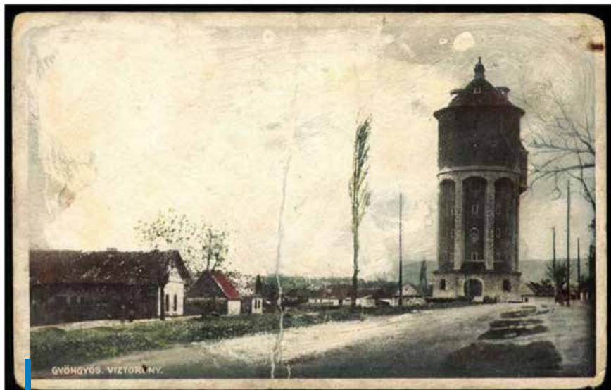
Képeslap, 1929 (Zempléni múzeum, (Szerencs))

„Jó mester” – ahogy tanítványai visszaemlékeztek rá – „jó ízléssel, szakértelemmel”, de bírálói „Wälder-féle iparbarokk”-nak minősítették műveit. Az azonban biztos, hogy a 142 éves született építész a két világháború közötti magyar építészeti egyik meghatározó alakja.