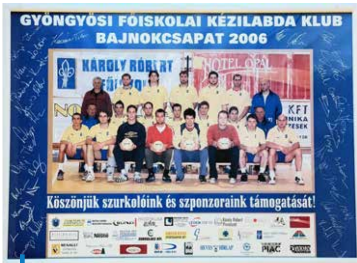
Az első gyöngyösi kézilabdacsapat, amelyik 20 évvel ezelőtt történelmet írt