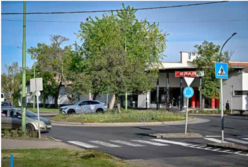
A Jókai utca és a hozzá kapcsolódó körforgalom is megújult