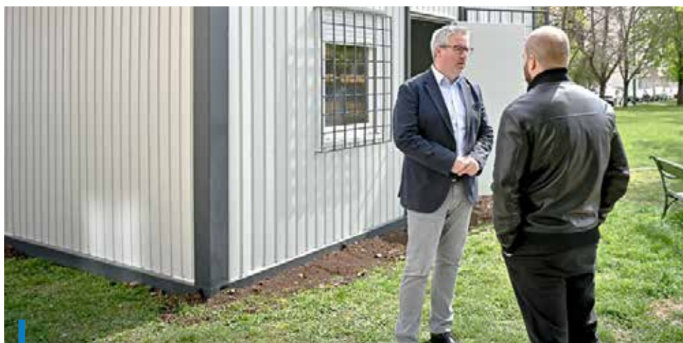
A konténeriroda lehetőséget ad a városrendészek állandó jelenlétére

Városrendészeti bázispont került a gyöngyösi buszpályaudvarhoz. Az új egység egy konténeriroda, melynek célja, hogy erősítse a rendészeti jelenlétet a területen, és hozzájáruljon az utazók, valamint a környéken élők biztonságérzetének növeléséhez. A autóbusz-pályaudvar és környezete kiemelt figyelmet igényel, ezért a városrendészet a jövőben még nagyobb hangsúlyt helyez erre a területre.