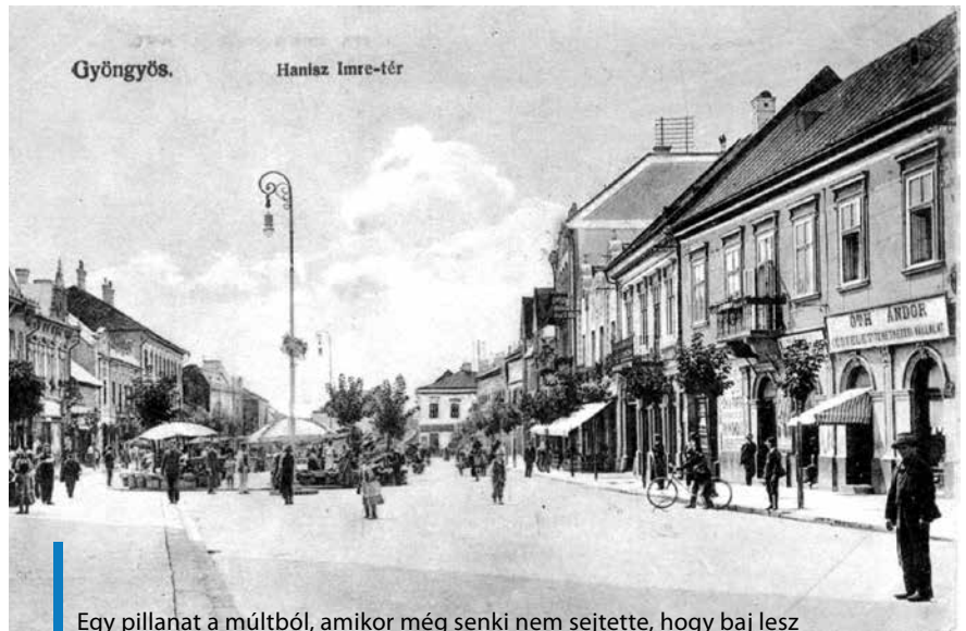
Egy pillanat a múltból, amikor még senki nem sejtette, hogy baj lesz

1917. május 21-én délután fél 5-kor azonban megtörtént az, amitől a lakók évszázadok óta rettegettek. A tüzek városában megkondultak a félrevert harangok. A kórház mosókonyhájából kipattanó szikra meggyújtotta az épület tetejét, és a tomboló szélviharban percek alatt lángtengerré változtatta Gyöngyöst, ökölnyi nagyságú paraszakát szórva házról-házra. Nemsokára a Kossuth Lajos utca, majd a Fő tér épületei is lángra kaptak. A lakosság nagy része pánikszzerűen elmenekült. Sokan a Kálvária-dombról nézték tehetetlenül a város és otthonaik elhamvadását. Vízvezeték még ekkor sem volt, így a tűzoltók a hagyomány