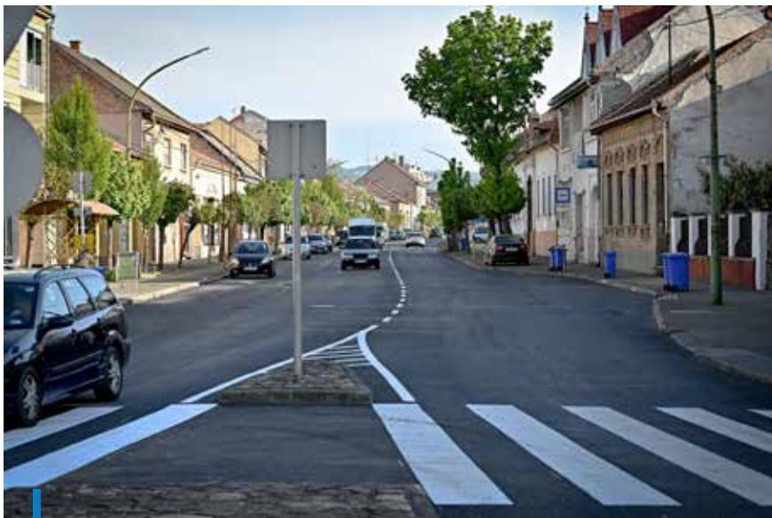
A Jókai út végében lévő körforgalom is új aszfaltburkolatot kapott

A jó idő beköszöntével elkezdődött a belterületi utak felújítása a városban. Az önkormányzat ütemezetten, egymás után a város több pontján is javított a közlekedési feltételeken.