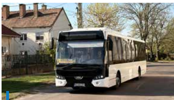
Áprilisban ingyen lehetett utazni a gyöngyösi buszokon