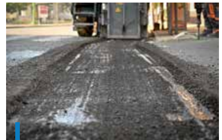
A Zrínyi utcában a régi burkolatot felmárták

A felújításokhoz kapcsolódva folyamatosan zajlott az útburkolati jelek megújítása is. A fekvőrendőriknél frissítették a felfestéseket, valamint több helyszínen, például a Platán úton, a Városcsatorna utcában és a Szövetkezet úton a parkolóhelyeket is átfestették. A tervek szerint a gyöngyösi utak felújítása a Thán Károly úton és a Honvéd utcában folytatódik. A beruházások miatt érdemes lesz a szokásosnál is óvatosabban közlekedni a belvárosban, ahol az érintett útszakaszokon forgalomterelésekre és forgalomkorlátozásokra lehet majd számítani.