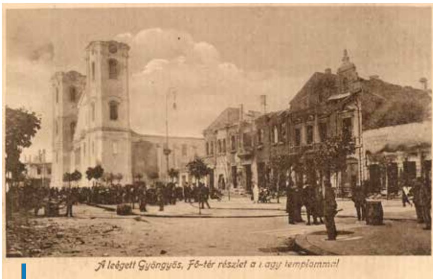
A leégett Gyöngyös, Fő-tér részlet a nagy templommal