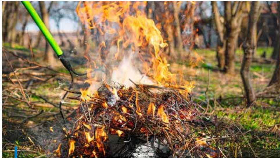
Gyöngyös közigazgatási területén az avar és a kerti növényi hulladék égetése tilos

Növényi hulladékot égetni kizárólag külterületen, Gyöngyös belterületi határától, valamint az erdő- és természetvédelmi területek határától számított 100 méternél távolabb eső, zártkerti és zártkerti művelés alól kivett ingatlanokon – Farkasmály, Mátrafüred, Sástó, Mátraháza és Kékestető települések kivételével – lehetséges április és október minden csütörtökén és vasárnapján. A tervezett avar és kerti hulladék égetés helyrajzi számmal azonosított helyét és időpontját a Gyöngyösi Közös Önkormányzati Hi-