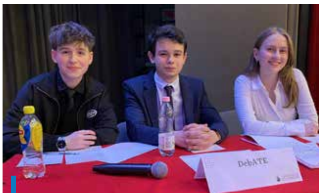
A győztes a gyöngyösi gimnázium DebATE nevű csapata lett

strukturált és meggyőző beszédeket tartottak. A zsűri több fordulón keresztül értékelt a csapatok teljesítményét. A döntés során kiemelt szempont volt az előadásmód, a be-