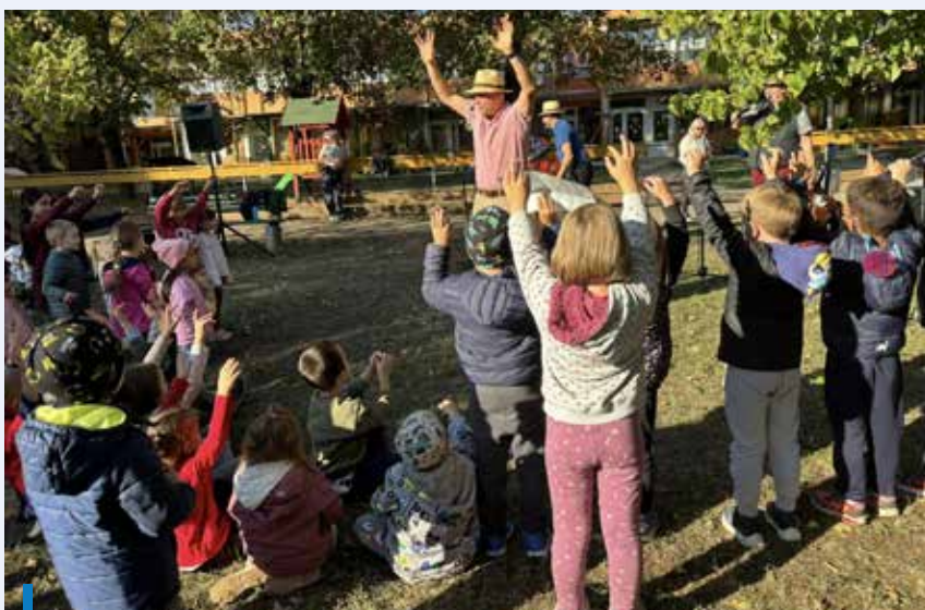
A hagyományörzés fontos része a nevelési programnak, így népzenevel is megünnepelték az óvoda születésnapját

N épzenevel, retró kiállítással, szüreti kavalkáddal és faültetéssel ünnepelte fennállásának 45. évfordulóját a Dobó Úti Tagóvoda. A programsorozathoz a gyerekek, a szülők és az intézmény munkatársai mellett az egykori dolgozók is csatlakoztak, akik egy a retró tárgyakból, egyéb régi emlékekből és fotókból összeállított kiállításon idézhették fel az óvoda múltját, amely 1980-ban 125 férőhellyel, 5 csoporttal kezdte meg működését. Az intézmény az elmúlt évtizedek alatt csoportszobákkal és létszámában is kibővült. A jeles alkalom kapcsán a Dobókocka Egészséges Gyermekéért Alapítvány az évforduló ajándékként 45 ezer forinttal támogat minden csoportot, valamint elkülönítettek 450 ezer forintot az udvari eszközök bővítésére.