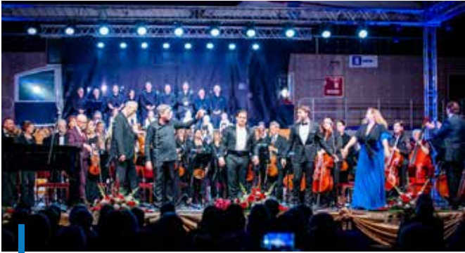
A gyöngyösi tehetségek mellett országosan ismert és elismert művészek léptek színpadra