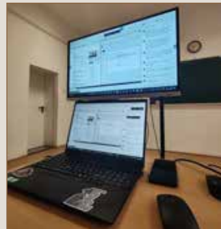
A József Attila Technikum is lépést tart a XXI. századdal

A Heves Vármegyei Szakképzési Centrum mesterséges intelligencia programozás képzése egyedülálló lehetőség az oktatók számára, hogy naprakész, mérnöki szemléletű tudást szerezzenek a technológia legmodernebb területein. A képzés kínai nyelven zajlik, valós idejű AI-alapú angol fordítással, amely már a tanítás során demonstrálja a mesterséges intelligencia működését. Oktatóink megismerkednek az AI típusával (ANI, AGI, ASI), a gépi tanulás alapjaival, a felügyelt és felügyelet nélküli tanulás módszereivel, valamint a Deep Learning és a Natural Language Processing (NLP) alkalmazásaival. A képzés során a robotika gyakorlati példái – például robotpókok – segítségével ismerhetik meg a technológia működését. A JASZK AI programja nemcsak a technológiai ismereteket adja át, hanem a nemzetközi mérnöki szemléletet is, felkészítve a fiatalokat a jövő innovációs kihívásaira. X