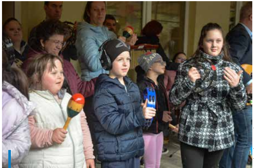
Több év szünet után újjáalakult és ismét zenél a Gyöngyszem zenekar

A Lokodi út 7. és az Ifjúság út 2. szám alatti ingatlan évek óta biztosít ellátást a városban és a járásban fogyatékkal élők számára. Az alapítvány mintegy tíz éve az önkormányzat, gyöngyösi magánszemélyek, gazdasági és közéleti szereplők támogatásá-