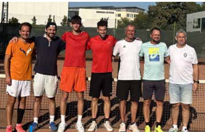
A K&V Gyöngy TSC OB II-es csapata

A K&V Gyöngy Tenisz és Sí Club (Gyöngy TSC) felnőtt játékosai 2024-ben az Országos Bajnokság második és harmadik osztályában is megmérették magukat. A mátraaljaiak – korábbi sikerüket túlszárnyalva – a nagyon erős OB II-es mezőnyben tavaly a harmadik helyen végeztek.