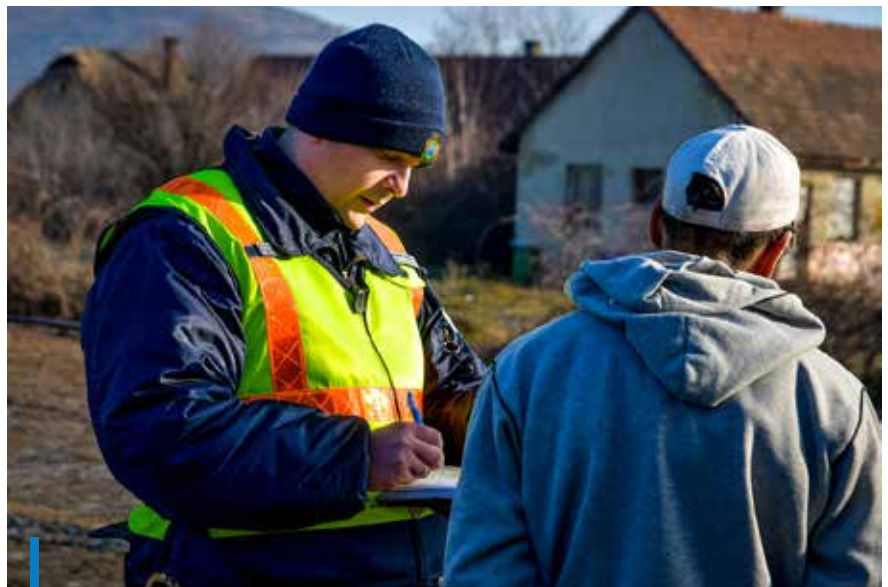
A városrendészek határozottan fellépnek a köztisztaság érdekében Gyöngyösön

A Gyöngyösi Városrendészet munkatársai folyamatosan tartanak közös ellenőrzést a rendőrséggel a autóbusz-pályaudvaron és annak közvetlen környékén, ahol legutóbb három fiatalt igazoltattak. Az ellenőrzés során kiderült, hogy mindhárman körözés alatt álltak, ugyanis megszöktek egy gyermekvédelmi intézetből. A rendőrség a helyszínen előállította őket.