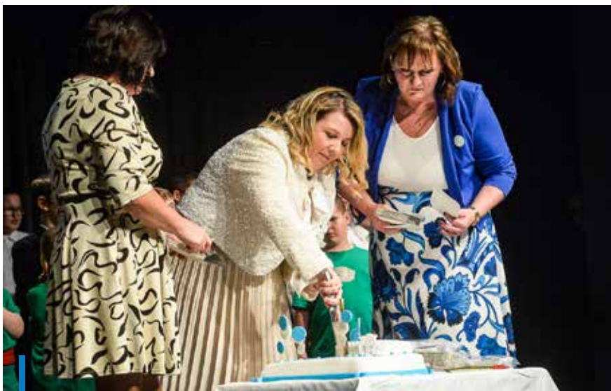
A jubileum alkalmából születésnap tortával ünnepeltek

Az intézmény óvodás kortól egészen a tankötelezettségük végéig, akár az el látottak 23 éves koráig ellátja a középsúlyos értelmi fogyatékos, integráltan oktatható autista és a halmozottan fogyatékos tanulókat is.