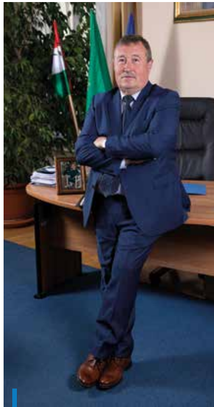
HIESZ GYÖRGY polgármester

A másik terület, ahol nem köthetünk kompromisszumokat, a közbiztonság. Minden elfogultság nélkül állíthatom, hogy Gyöngyösön az ország legjobb és legeredményesebb városrendészete működik, amely létszám és eszközállomány tekintetében a Gyöngyös népességének többszörösével bíró városok vagy fővárosi kerületek hasonló szervezeteit is felülmúlja. Elsődleges feladatuk persze nem a bűnüldözés lenne, hiszen az a rendőrség feladata, mégis óriási szükség