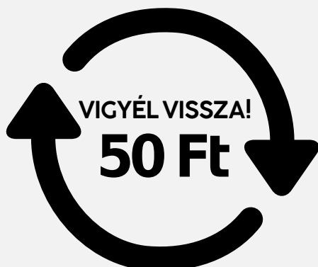
Egyszer használatos, egyutas palack jelölése

Az alábbi jelöléseket kell keresni 2024. január 1. után a 0,1–3 liter közötti kiszerelésű ásványvizés, üdítő, sörös, boros és szeszesital csomagolásokon, legyenek azok műanyag vagy üveg palackok vagy fémdobozok: