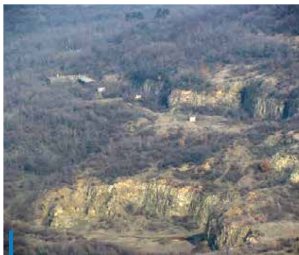
A Szár-hegy gyomrában kialakított egykori Tömegcikk Művek Nemzeti Vállalat

A Nógrád vármegyei Jobbágyi mellett a Falanszter című blog szerint több mint négyezren dolgoztak valamin teljes ti-