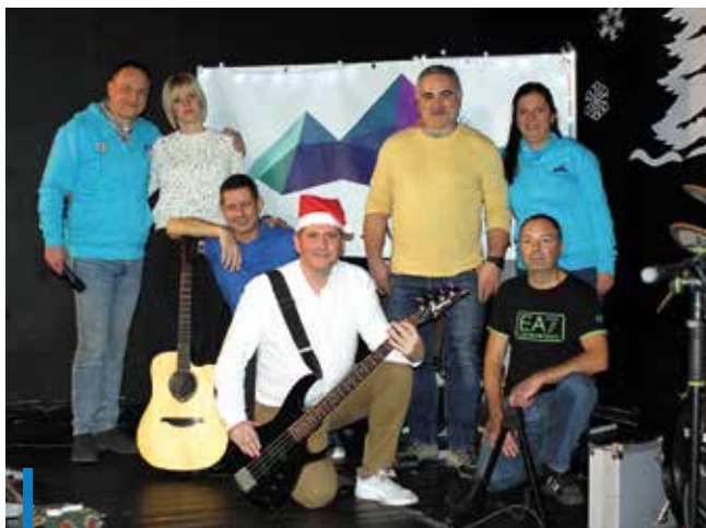
Az adventi rendezvényt az Empty Pubs zenekar zárta

Már több éve a településen is hagyomány az adventi ablaknaptár. December 1-én kezdték, és egészen szentestéig minden nap egy feldíszített ablakban kigyúltak az adventi fények. Nagyon népszerű ez a Felső-Mátarában is, hiszen ebben nemcsak a helyi lakosok vesznek részt, hanem a vendégház-tulajdonosok, vállalkozók is. Mátraszentimre községi önkormányzatának fontos, hogy az ünnepi időszakban is együtt tartsa, összehozza a lakosságot, a hozzájuk érkező vendégeket.