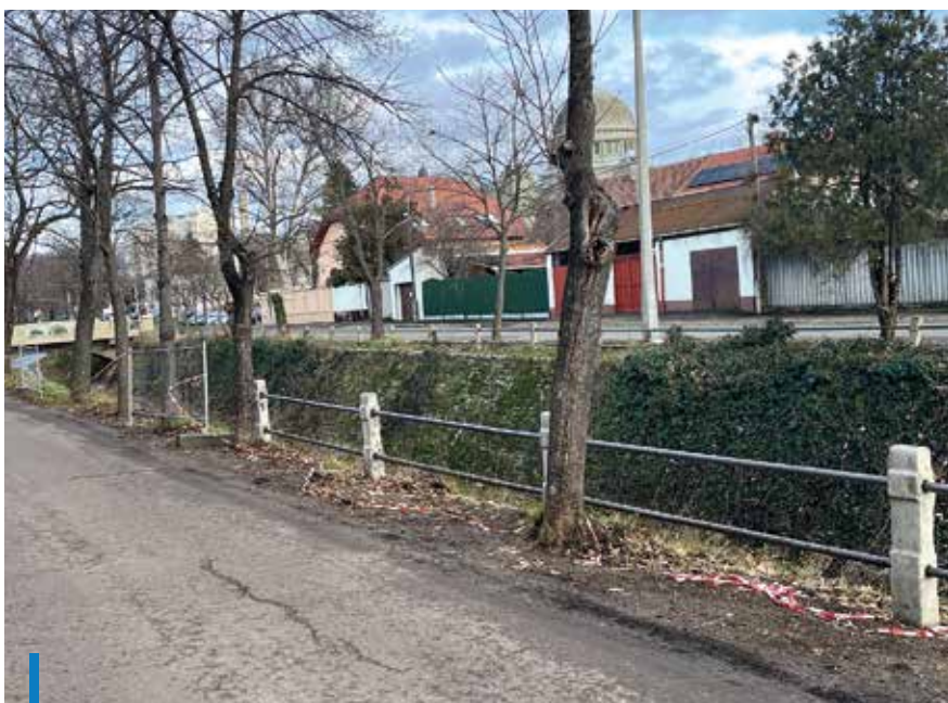
FOTÓ: GYÖNGYÖSI MÉDIAKÖZPONT

A képviselő-testület legutóbbi ülésén a költségvetési rendelet módosításában szintén döntöttek 4-es körzetet érintő fejlesztésekről. Az általános tartalék fejlesztési célú felhasználásával összefüggésben az alábbi döntések születtek: 3 millió forintot biztosít az önkormányzat a Gyöngyös-patak védőkorlátainak javítására a Vármegyeház tértől a Zalár utca teljes hosszában; több mint 3 millió forintot fordítanak a körzetben kamerák telepítésére és a szükséges áramellátás kiépítésére; további egymillió forintból a tér és utcaburkolatot javítják a Vachott Sándor és a Huszár utca közötti szakaszon; valamint közel félmillió forint értékben hulladékgyűjtőket helyeznek ki.