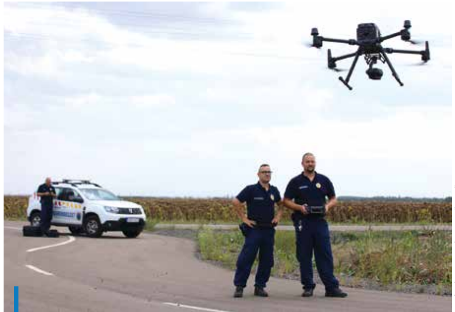
A drón szeptember óta teljesít szolgálatot Gyöngyösön

ták mind a rendőrök, mint pedig a városrendészek, hogy a bűnözők vasúton érkeznek a városba. A folyamatos ellenőrzéseknek és a hatékonyabb fellépésnek köszönhetően az igazgató szerint jelentősen csökkent azon bűnelkövetők száma, akik vasúton érkeznek. A rendőrséggel közös szolgálatok során 128 igazoltatás és 15 előállítás történt, ez utóbbiak főként körözés alatt álló személyek voltak, vagy drogbirtoklás miatt kellett velük szemben intézkedni. Emellett 47 esetben tartottak vissza és adtak át bűnözőket a rendőrségnek. Az egyenruhások tapasztalatai szerint jelentősen csökkent, sok esetben pedig eltűntek az erőszakos kéregetők a bevásárlóközpontok környékéről, konszolidálódott a belváros, valamint a buszpályaudvaron is gyakoribbá váltak az ellenőrzések – tette hozzá az igazgató