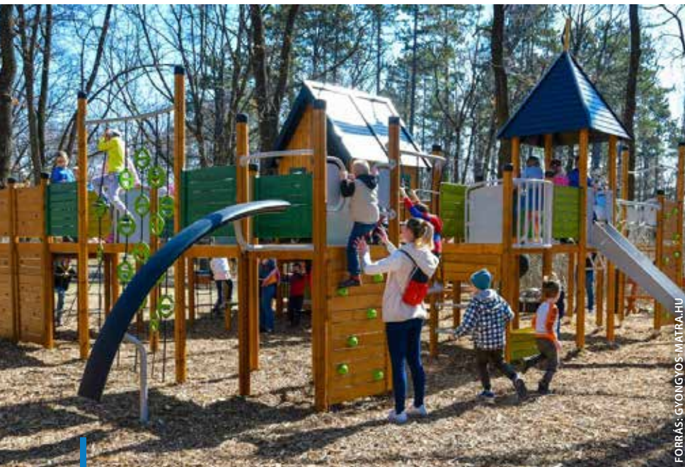
FORRÁS: GYÖNGYÖS MÁTRAHU

A mesejátszótér volt a legnagyobb értékű, körzetet érintő fejlesztés 2022-ben