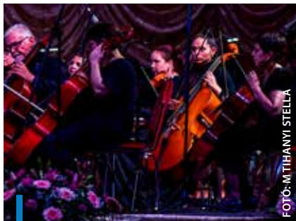
Az új szempontrendszer révén szélesebb kört tudnak támogatni

tív szempontok szerint ossza fel a kulturális szervezetek vagy magánszemélyek között a támogatási keretet. Azok a szervezetek, amelyek nagyobb létszámmal működnek, több programot valósítanak meg, magasabb minősítéssel bírnak, több fiatal foglalkoztatnak, nagyobb hatást gyakorolnak a város kulturális életére, magasabb összegű támogatásban részesülhetnek. A javaslat szerint a pályázatokat egy állandó, öttagú bizottság véleményezi majd, amely a város kulturális életében meghatározó szerepet betöltő szakemberekből áll. A bírálati rendszer a Kulturális koncepció részét fogja képezni, arról pedig a kulturális kerekasztal is véleményt alkot majd. A képviselők számos ja-