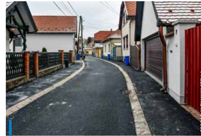
A tavalyi évben számos olyan önkormányzati kezelésben lévő út megújult, amely régi adóssága volt a városnak

rendszer, illetve a térfigyelő kamerarendszer működtetésére. A köznevelési feladatok közül az önkormányzat fő feladata továbbra is az óvodai ellátás lesz, hiszen – mint ahogy a városvezetők többször megfogalmazták – a kialakult negatív gazdasági környezetben az óvodák és a bölcsődék működtetése és a szociális ellátás nem szenvedhet hiányt. Közutak fejlesztésére ebben az évben közel 98 millió