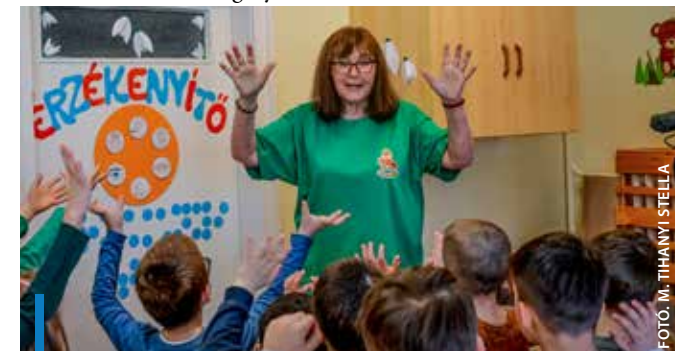
Gyöngyös öt óvodájába keresnek óvodapedagógust

A pályázati kiírások teljes szövege a www.gyongyos.hu oldalon, a karrier menüpontban olvasható.