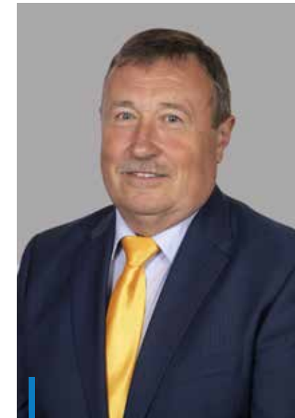
HIESZ GYÖRGY polgármester

Ehhez azonban arra is szükség van, hogy a takarékosági intézkedéseinket végigvigyük. Tudom, sokaknak okoz kényelmetlenséget, hogy zárva van a művelődési ház, a könyvtár vagy a sportlétesítmények, azonban ha ezeket a lépéseket nem tettük volna meg, az energiaköltségeink teljesen elszálltak volna. A félévi elszámoláskor látjuk