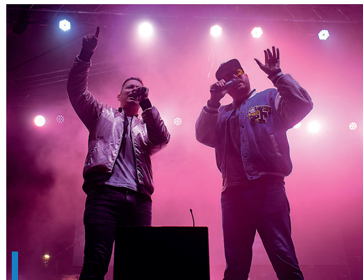
A gyöngyösieknek sem kellett hiányolniuk az egyik legnépszerűbb könnyűzenei együttest, a Wellhello-t