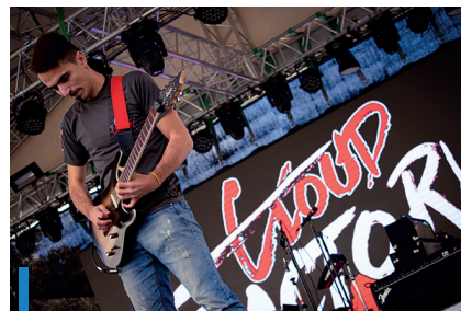
Modern metál a Mátra kapujában