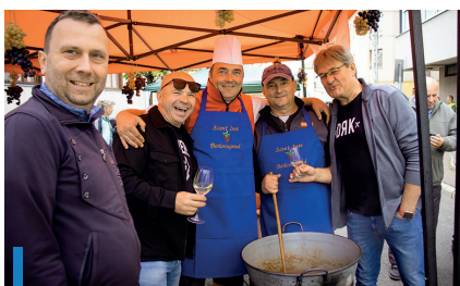
15 csapat ragadt fakanelat a XXII. Görgényi László Főzőversenyen