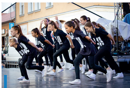
A BlackJam ezúttal is felrobbantotta a színpadot