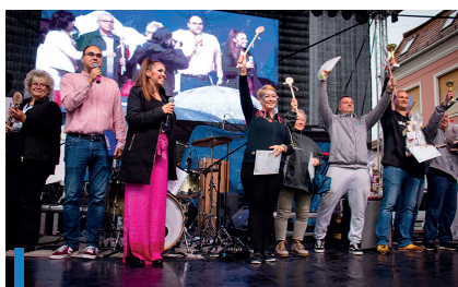
A Mátraaljai Munkaadók Egyesülete és a Marhajó tarolt a főzőversenyen