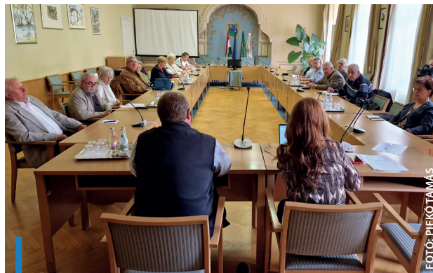
Hosszú idő után tudtak ismét tanácskozni a legfontosabb témákról

Az Idősügyi Tanács idén még egyszer találkozik.