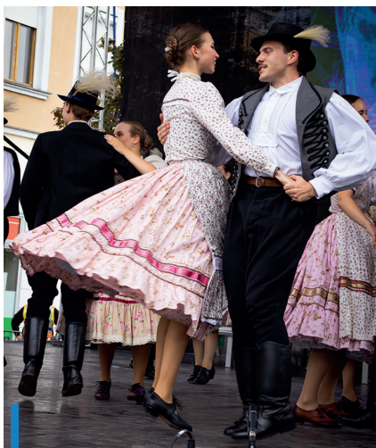
Az idén 60 éves Vidróczki Néptáncgyűttes egy rendezvényről sem hiányozhat

Az eső ellenére több ezren látogattak ki Gyöngyös egyik legnagyobb fesztiváljára, a Mátrai Szüreti Napok és Fehérbor Fesztiválra. 19 borász kínálta a jobbnál jobb nedűket. A közönség esti szórakoztatásáról az Apostol, a Wellhello és a Kiscsillag gondoskodott. Mellettük Hevesi Tamás, Báder Ernő és zenekara, a Betty Love, a Fiúk, Erox Martini és a Platon Karataev is színpadra lépett, de több helyi csoport is bemutatkozott, mint például a Vidróczki Néptáncgyűttes, az Attitude Táncműhely, a Bellydance Artistique, a Black Jam!, a Fitt Kriszti Tánciskola, a Gyöngyösi Játékszín, a Fortuna TSE és a Cloud Factory is. Megrendezték emellett a XXII. Görgényi László Főzőversenyt, amelyet pörkölt kategóriában a Mátraaljai Munkaadók Egyesülete, míg gulyás kategóriában a Marhajó nevű csapat nyerte.