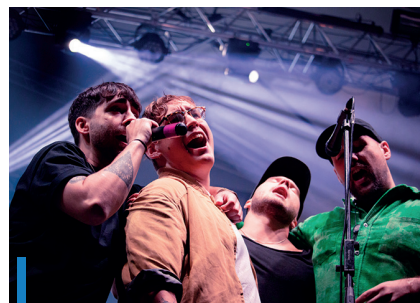
Szakadó esőben is zúztak a Fiúk