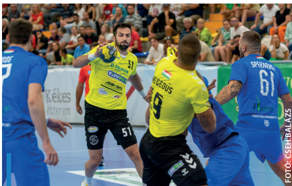
Jól sikerült a szezonkezdet a HE-DO B. Braun Gyöngyös számára

ahol történelmi sikert ért el, legutóbb ugyanis 2013-ban sikerült pontot szerezni a Balaton partján, ezúttal pedig kis szerencsével akár a győzelem is összejöhetett volna a tavalyi bronzérmes ellen. A védekezésben remeklő gyöngyösi együttesnek a Dabas ellen egy nagyon küzdelmes, szoros mérkőzésen sikerült egygólos győzelmet aratnia, így a harmadik forduló után öt pontot tudhatott magáénak.