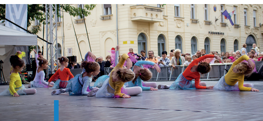
Az Attitude Táncműhely legfiatalabb növendékei is megmutatták tehetségüket