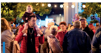
Kicsik és nagyok egyaránt jól érezték magukat a Fő téren