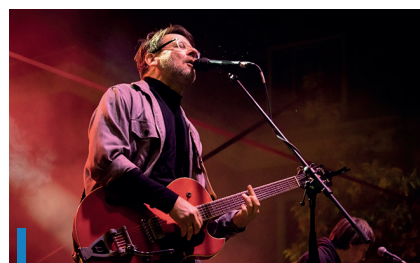
A háromnapos fesztivált a Kiscsillag koncertje koronázta meg