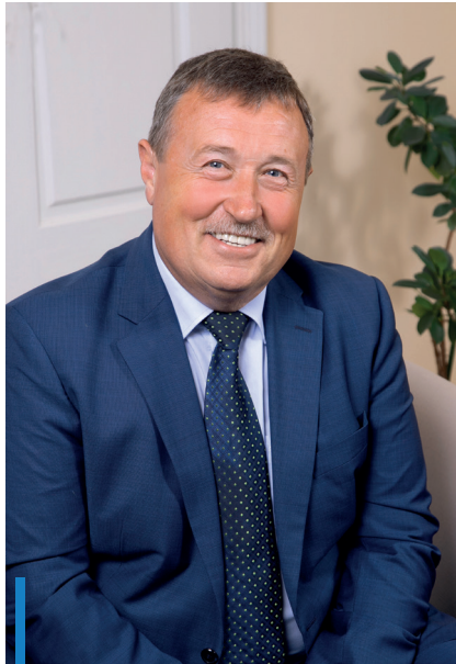
HIESZ GYÖRGY polgármester

A nemzetközi energiahelyzet egyre fokozódik – A tanú című film klasszikussá vált mondata a most zajló folyamatokra is ráilleszthető. Bár még mindig nem látunk teljesen tisztán az energiaárak tekintetében, az már biztos, hogy a gázért a beszerzés időpontjától függően 11-25-szörös árat fizetünk majd, és a villamosenergia díjai is legalább tízszeresére drágulnak a szakértői várakozások szerint. Ebben a helyzetben alaposan át kell tekintenünk az önkormányzat működését, és ahol csak lehet, racionalizálni kell az energiafogyasztásunkat.